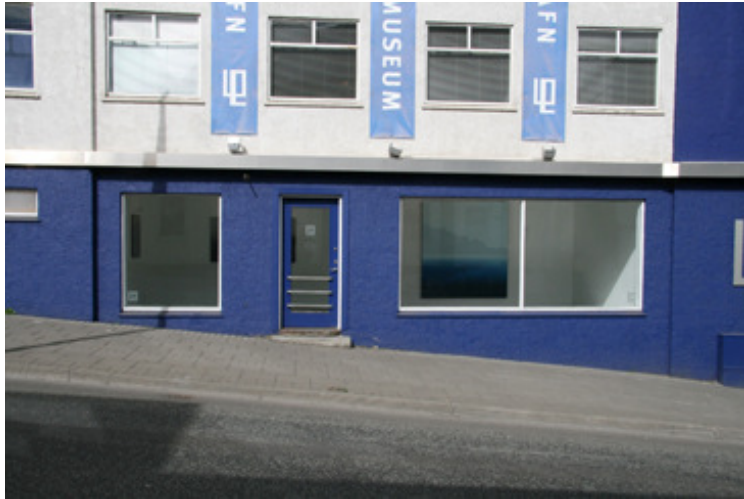
Séð inn í galleríð frá götunni.